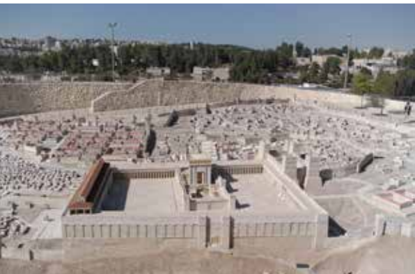
Model af Jerusalem og Herodes tempel på Israel Museum, Jerusalem